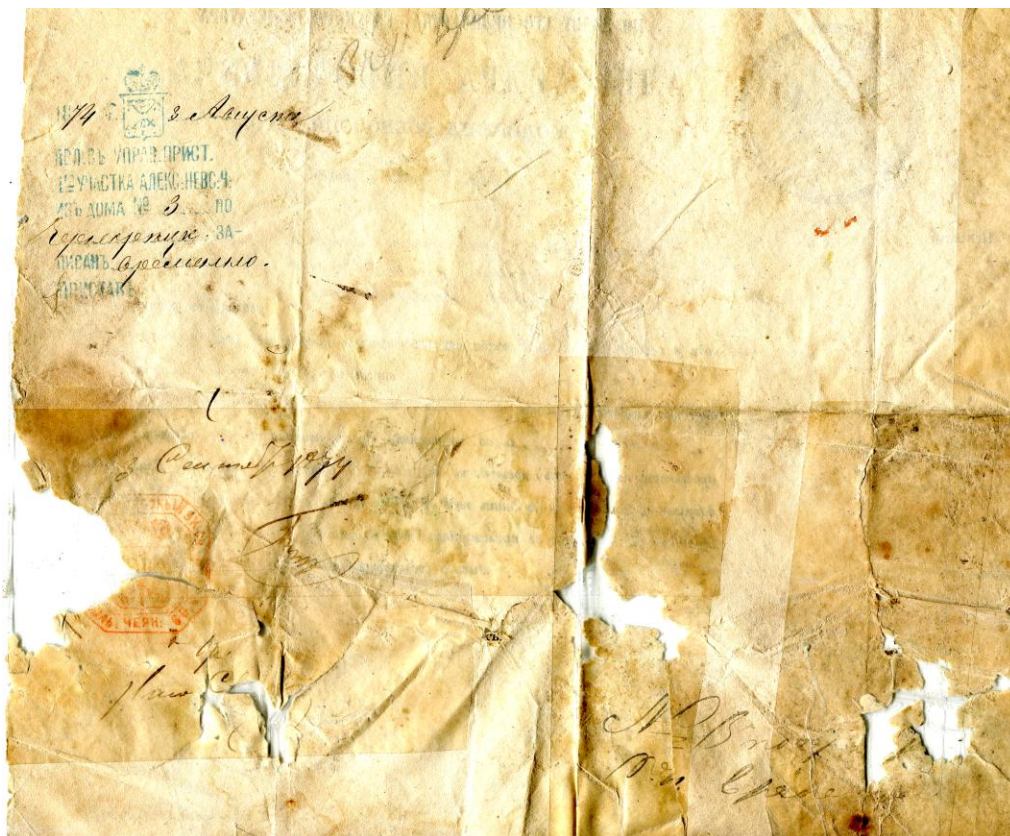
Обратная сторона паспорта

надобностей от ниженаписанного числа впредь на один год, то есть: тысяча восемьсот семьдесят пятого года по 30 число апреля. А по прошествии срока явиться ему обратно; в противном случае поступлено с ним будет по законам. Дан по документу записанному в книге под № 1390 из Мардинского волостного правления с приложением печати оною. Дан тридцатого апреля тысяча восемьсот семьдесят четвёртого года». Ниже стоят должность и фамилия лица, выдавшего паспорт. С левой стороны указаны приметы лица, получившего этот паспорт, а именно: возраст, рост, цвет волос, бровей, глаз, форма носа, рта, подбородка. Особые приметы. Стоит печать Мардинского волостного правления (предшественника Чекуевского Совета). На обратной стороне стоят штампы о прописке и выписке, сделанные уже в Петербурге