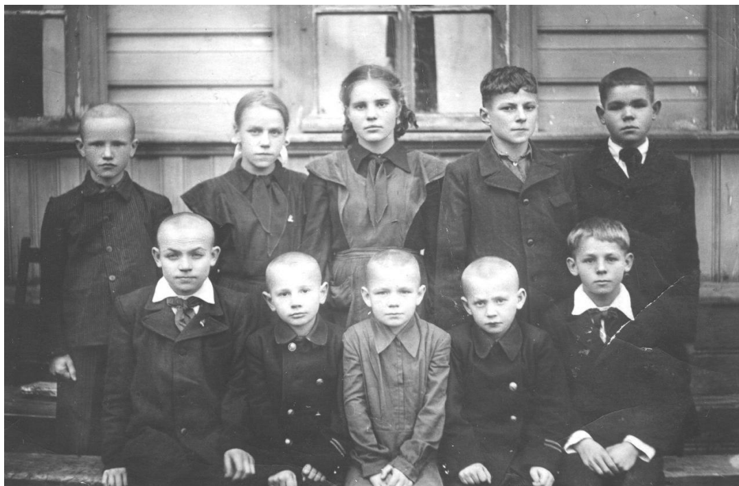
Детдом, последний год до закрытия.1954-55гг.