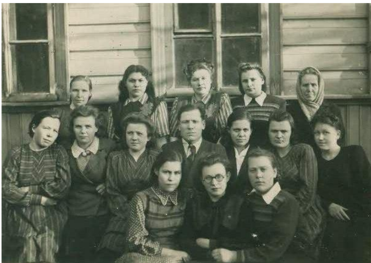
Коллектив детского дома в д. Поле: 1951 год.