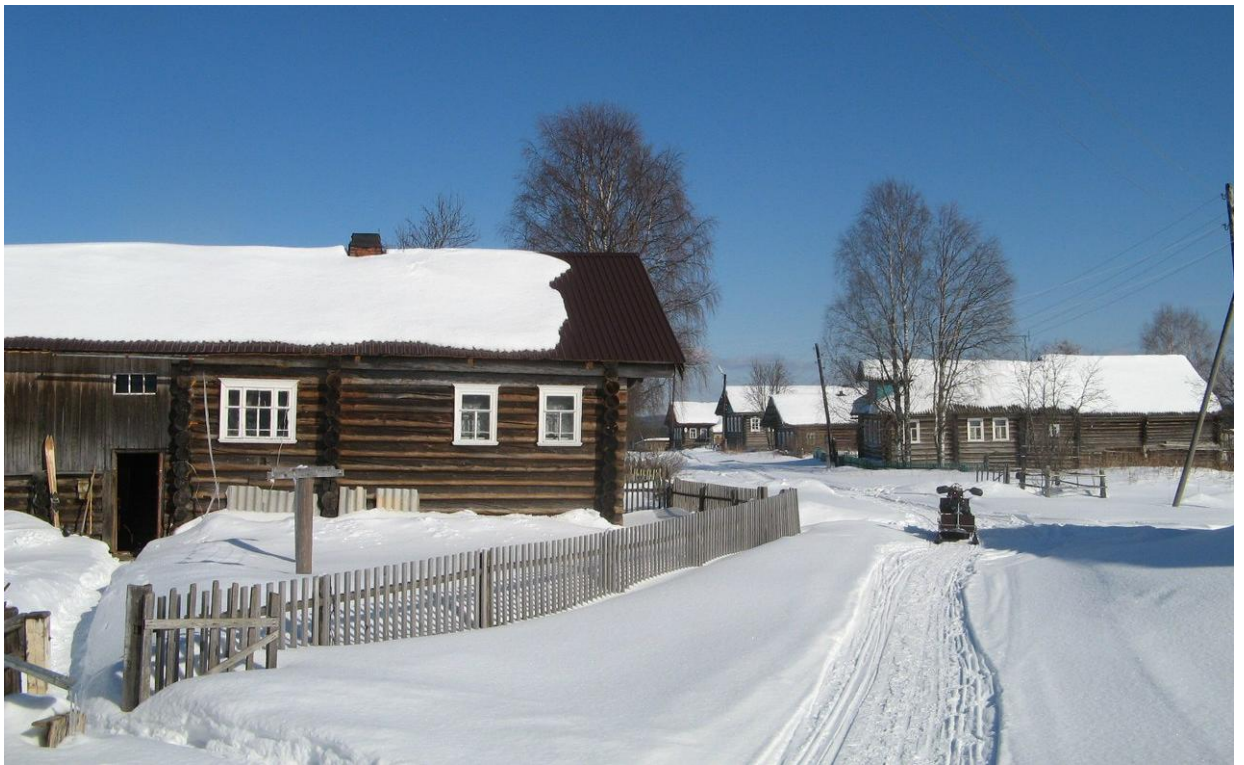
Фотографировали деревню на Горе от дома Попова И.И.