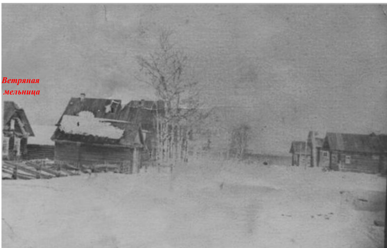
Слева остатки высокого дома - Попова И.М. дом пошел под снос.